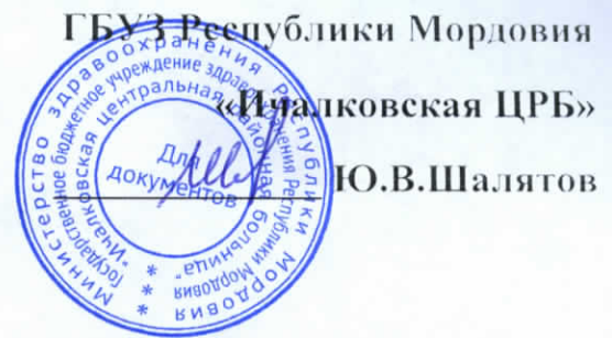
График проведения профилактических медицинских осмотров и диспансеризации, включая субботние дни и вечернее время на март 2020 года.